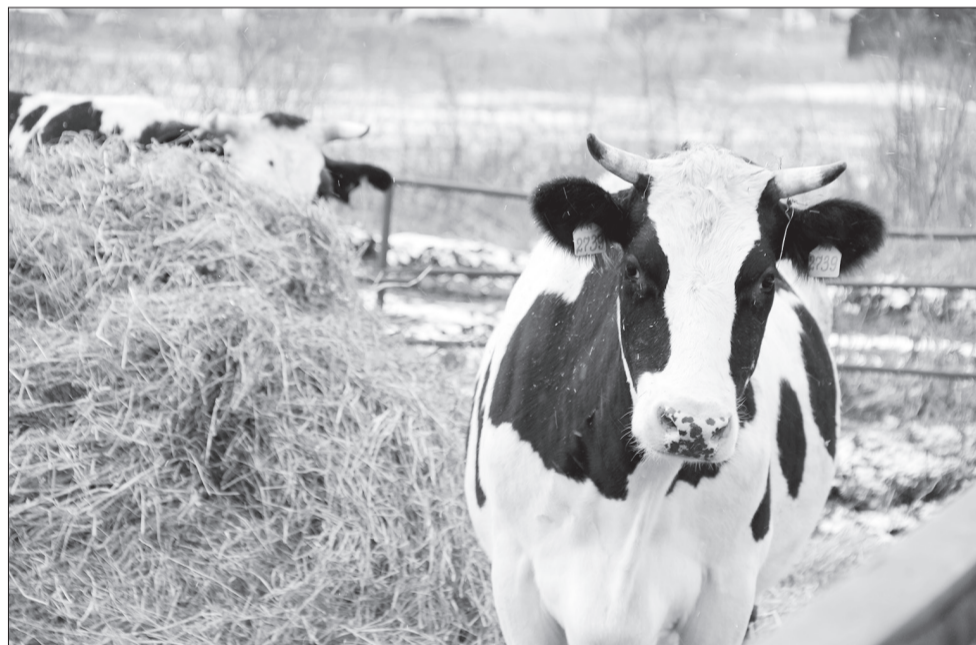
Как говорят специалисты, разработаны инновационные технологии в области воспроизводства КРС.